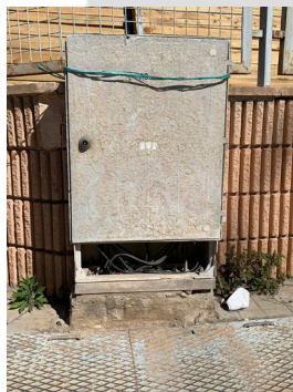
Calle Regalicar. Armario de luz en mal estado.