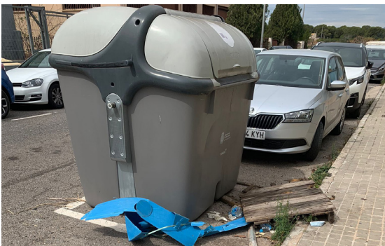
Calle Pont Sec. Vertido de enseres.