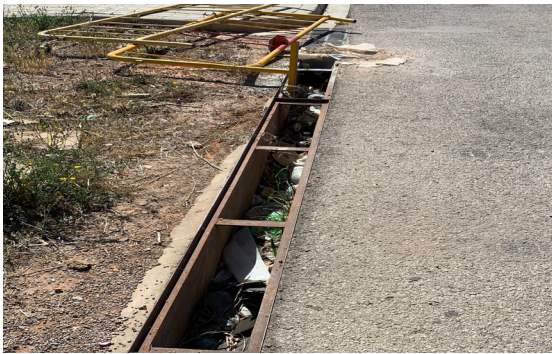
Calle Huelva. Canalización sin trapa.