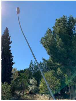
Calle Císcar. Farola doblada.