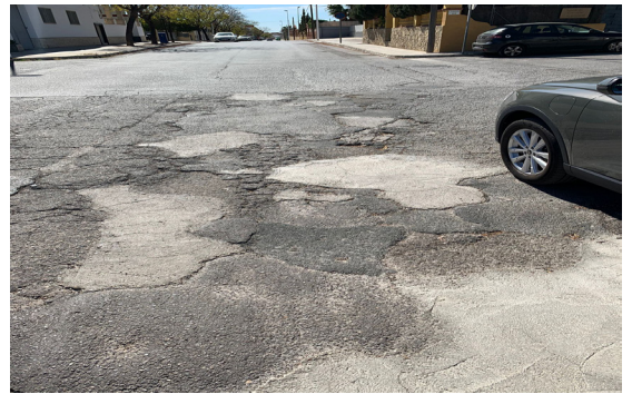
Todo el parque. Deficiencias en el asfaltado.