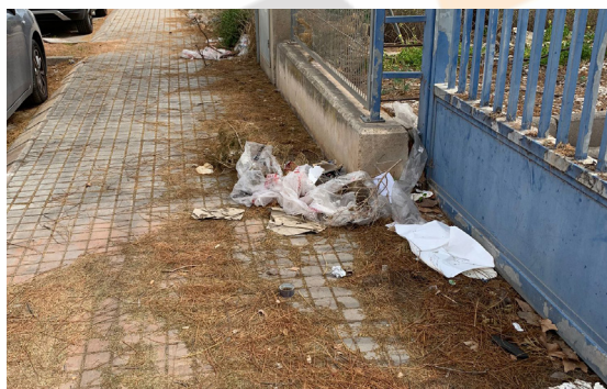
Calle Quinsà. Suciedad invade la acera.