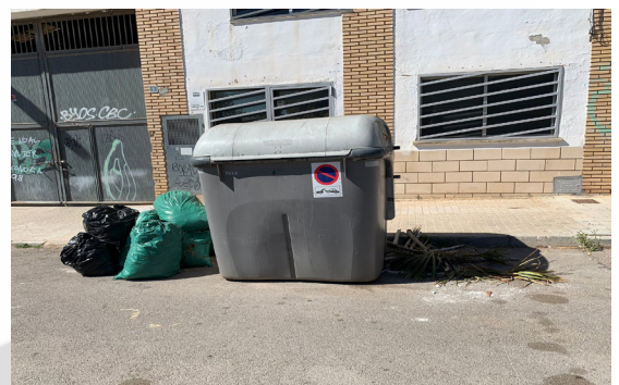
Calle 220. Basura que no cabe en los contenedores y restos de poda.