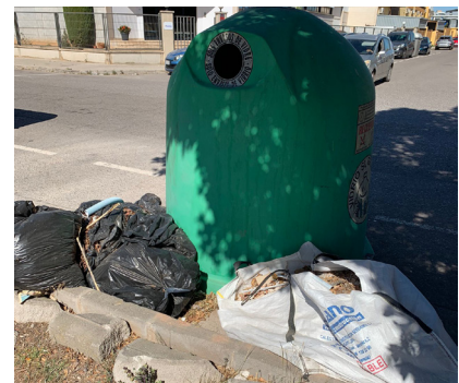
Calle Els Francs. Restos de poda depositados sin control.