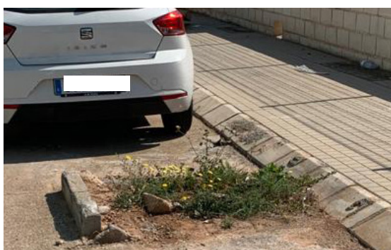
Avda. Paret del Patriarca. Alcorque roto y sin plantar.