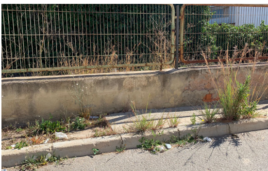
Calle 220. Aceras sin mantenimiento y llenas de maleza.