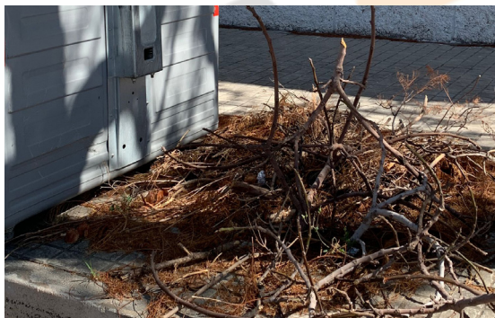
Calle Sevilla. Restos de poda depositados sin control.