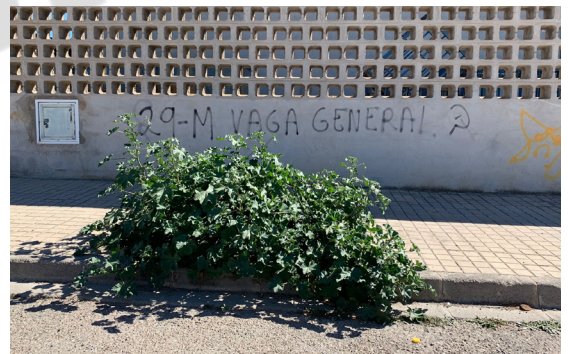
Calle 128. Alcorque sin mantenimiento.