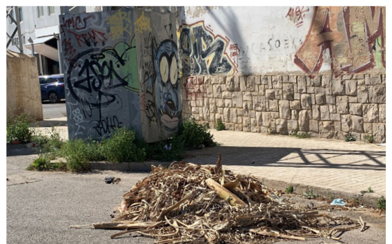
Calle 220. Restos de poda depositados sin control.