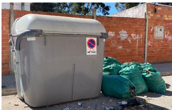
Calle Granada. Restos de poda depositados sin control.