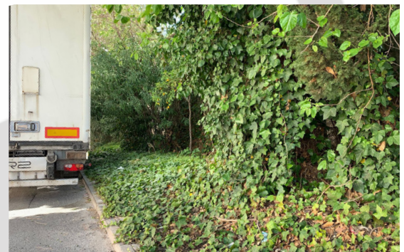
Calle Císcar. Vegetación invade la acera.