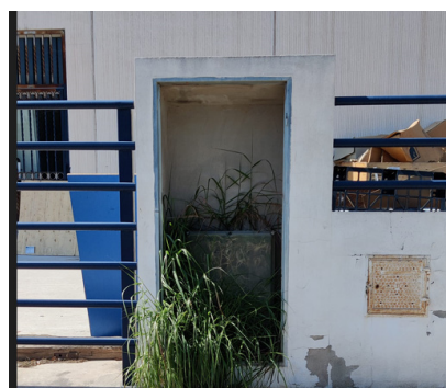
Calle El Molí. Armario sin puerta y repleto de maleza.