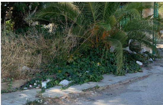
Calle Císcar. Vegetación invade la acera.