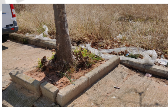
Calle Moroder. Alcorque roto.