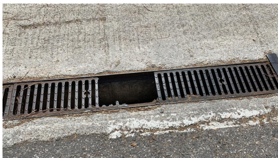
Calle Quinsà. Rejilla rota (ya ha causado dos incidentes en trabajadores)