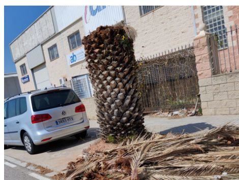
Avda. Paret del Patriarca. Restos de poda de palmera sin retirar.