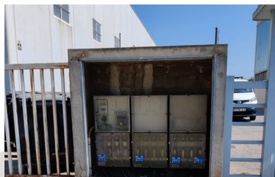
Calle Pla de Foios. Armario sin puertas.