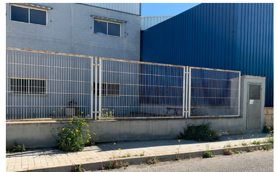
Calle Regalicar. Aceras poco mantenidas.