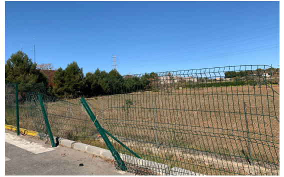
Calle Pla de Andanes. Valla rota.